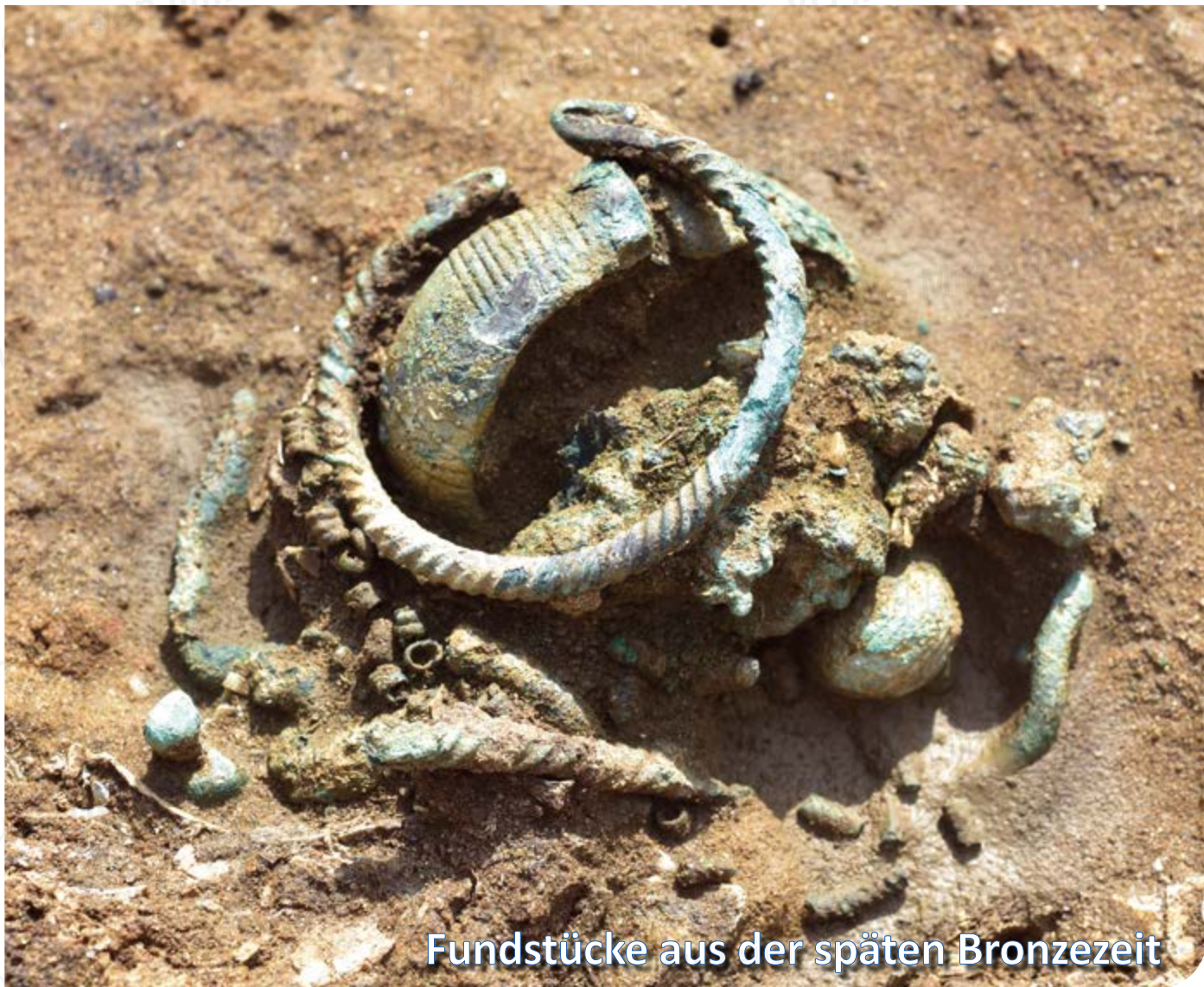
Fundstücke aus der späten Bronzezeit