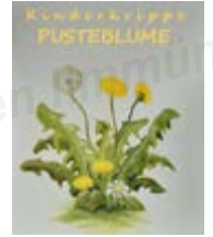
Bilder und Text: Kinderkrippe Pusteblume

Weiter geht es mit der Vorfreude auf das Frühlings- und Osterfest. Es erwarten uns spannende und kreative Tage, in denen wir uns auf das Fest der Auferstehung vorbereiten und die Freude der Kinder auf Ostern teilen.