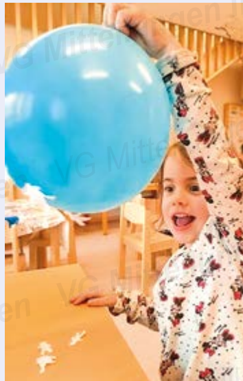
Bilder und Text: Kinderhaus Ilmzwergerl

Zwischen Fasching und Ostern, nutzen wir die Zeit und erkunden weiter die Welt um uns herum. Immer wieder begegnen uns Gegebenheiten in unserer Umwelt, die auf den ersten Blick nicht zu erklären sind. Mit Experimenten versuchen wir uns mit diesen Phänomenen vertraut zu machen und sie zu verstehen. Die Kinder sind mit viel Entdeckerspaß, Ausdauer und Neugierde bei der Sache. Der „magische Luftballon“ zum Beispiel zieht wie von Zauberhand alles an, was in seine Nähe kommt. Die Kinder probierten diese kleine Zauberei gleich selbst aus. Mit einem Luftballon, etwas Papier und ganz viel Reibung erzeugten wir eine statische Aufladung. Natürlich experimentierten wir danach auch damit, was außer kleinen Papiermännchen noch alles vom aufgeladenen Luftballon angezogen wird. So macht uns allen die Bildungsarbeit im Bereich Naturwissenschaften richtig Spaß.