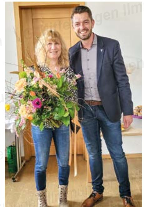
Bilder und Texte: Kiga Illmünster