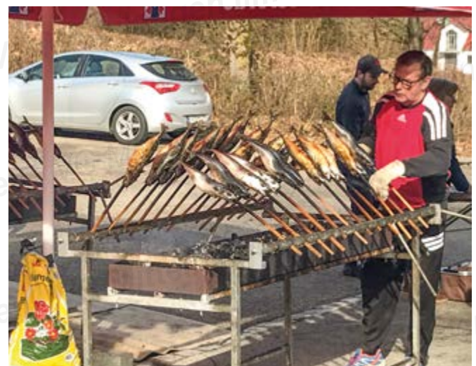
Erfahrung und eine gute Hand bringen den Fisch auf den Punkt