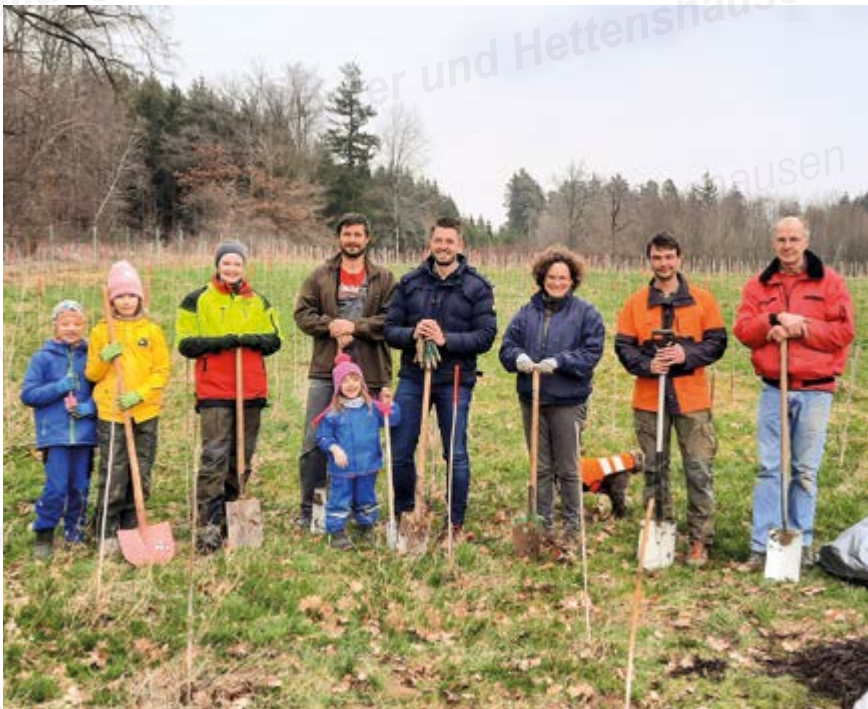
Die Helfer der Nachpflanzaktion im Gemeindewald