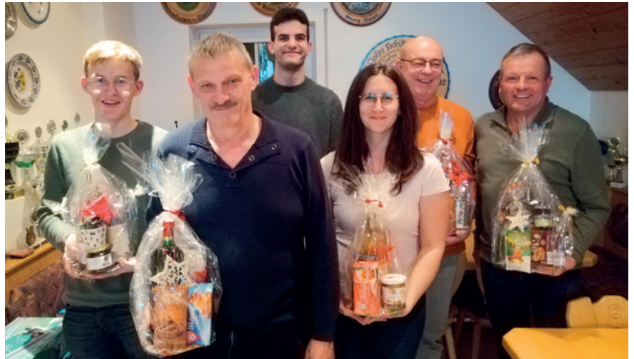
Die Sieger des diesjährigen Nikolausschießen freuen sich über ihre tollen Preise

Weitere Höhepunkte bildeten der Besuch des Nikolaus sowie eine Tombola mit zahlreichen hochwertigen Preisen. Der Erlös kam der Vereinskasse zugute. Allen Spendern und Helfern ein herzliches Dankeschön.