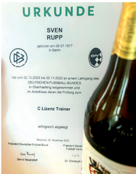
Die war aller Mühen wert