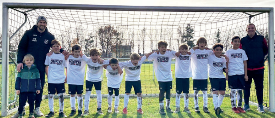
So sehen Sieger aus