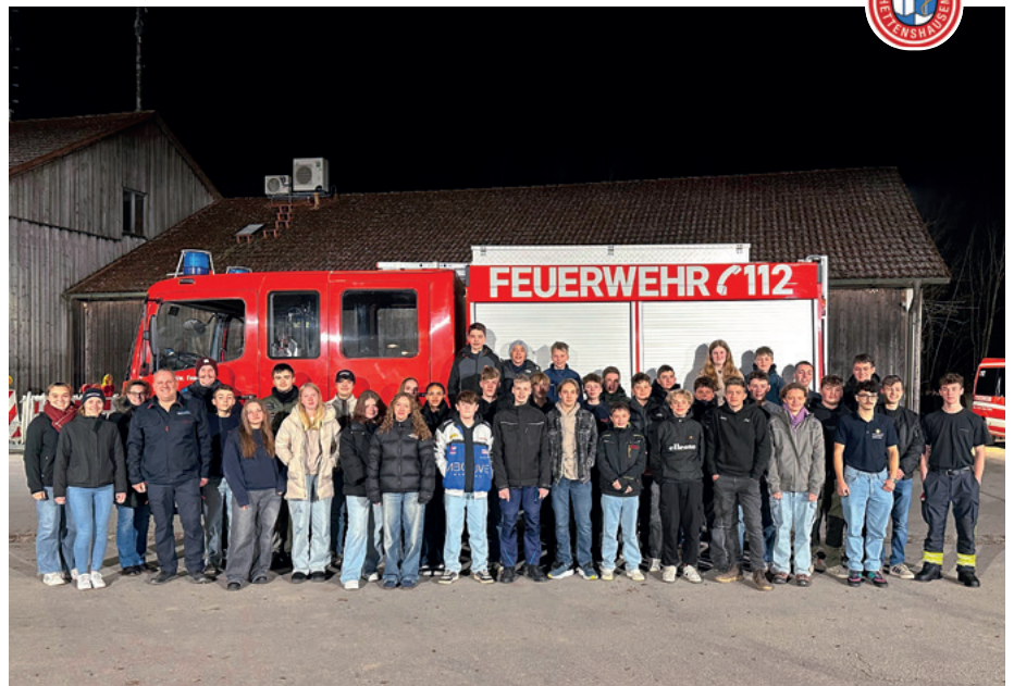
Die Jugendfeuerwehren Scheyern und Hettenshausen

Feuerwehrautos – vielen Dank an das Team fürs Kommen!