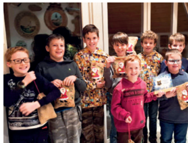
Lauter strahlende Gesichter nach dem Nikolausschießen