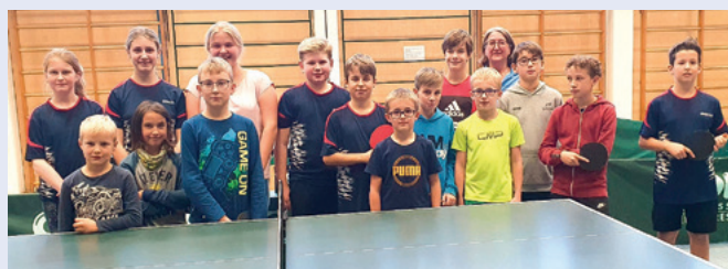
Teilnehmer der mini-Meisterschaften 2022

Wer gerne Tischtennis spielt oder dies gerne einmal ausprobieren möchte, der darf sich auf den 17. Januar 2026 in der Schulturnhalle in Illmünster freuen. Hier sind die Kleinsten ab 14.00 Uhr beim Ortsentscheid der mini-Meisterschaften unter der Regie der Tischtennisfreunde Illmünster einen Tag lang die Größten. Bei den mini-Meisterschaften geht es um den Spaß am Spiel. Mitmachen dürfen alle sport- und tisch-