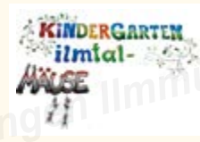
Bilder und Text: Kiga Hettenshausen/Elternbeirat

Neben all diesen besonderen Aktionen nutzten wir die ersten warmen Tage für Spaziergänge und entdeckten dabei, wie der Frühling langsam erwacht.