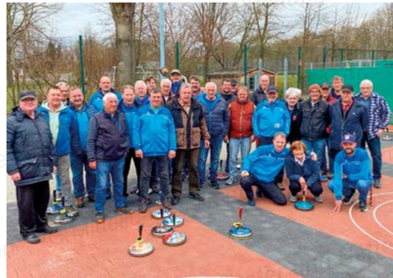
Die Teilnehmer des Osterturniers der Stockschützen Illmünster